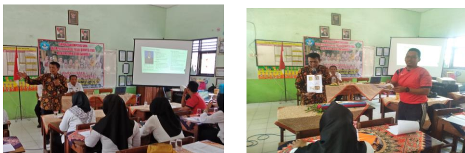
Gambar Pelaksanaan KKG Mini Siklus I

Semua peserta tampak bersemangat untuk mendengarkan dan mengamati narasumber dalam menjelaskna materi. Dari hasil pengamatan, peserta sangat senang karena mendapatkan ilmu dan pengetahuan baru yang bisa diterapkan pada saat kegiatan belajar mengajar di sekolah.