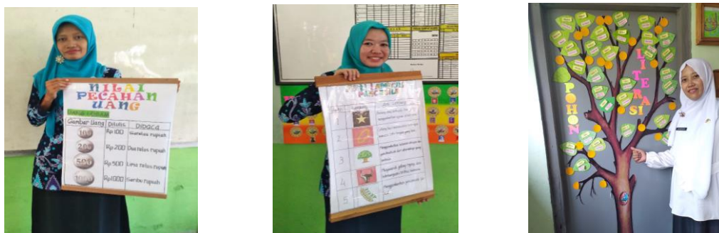
Gambar contoh media yang dihasilkan guru

Pada tabel di atas, tampak bahwa evaluasi untuk sasaran (guru) dalam pembuatan media pengembangan media pembelajaran berbasis literasi. Berdasarkan hasil penilaian terhadap pembuatan media pembelajaran berbasis literasi yang telah dibuat guru, dinyatakan dari 15 orang guru terdapat 9 orang atau 60% guru memperoleh nilai diatas 71 dengan kategori B (baik), 1 orang guru atau 6.7% mendapat nilai di 70 dengan ketegori C (cukup) dan 5 orang atau 33.3% guru mendapatkan nilai dibawah 55 kategori D (kurang).